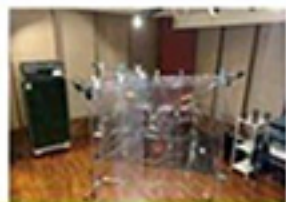
飛沫防止シートのレンタル （無料レンタル）