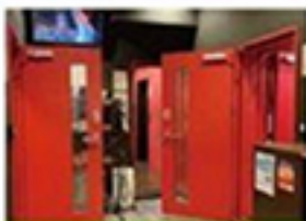
お客様入室前の スタジオ内換気を徹底