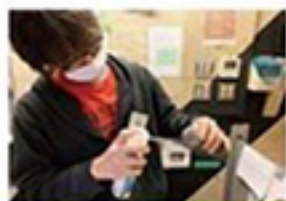
ご使用後マイクを 全て除菌しています

いつも当スタジオをご利用いただき、誠にありがとうございます。 お客様に少しでも安心して利用していただくために様々な対策を実施しております。