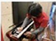
レンタル機材の除菌清掃