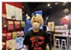
スタッフのマスク着用