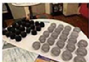
定期的にマイク（グリル）の 洗浄、消毒を行っています