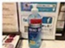
消毒用アルコールを常備