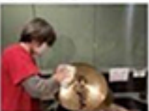
常設機材の除菌清掃