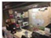
受付カウンターに ビニールシートを設置